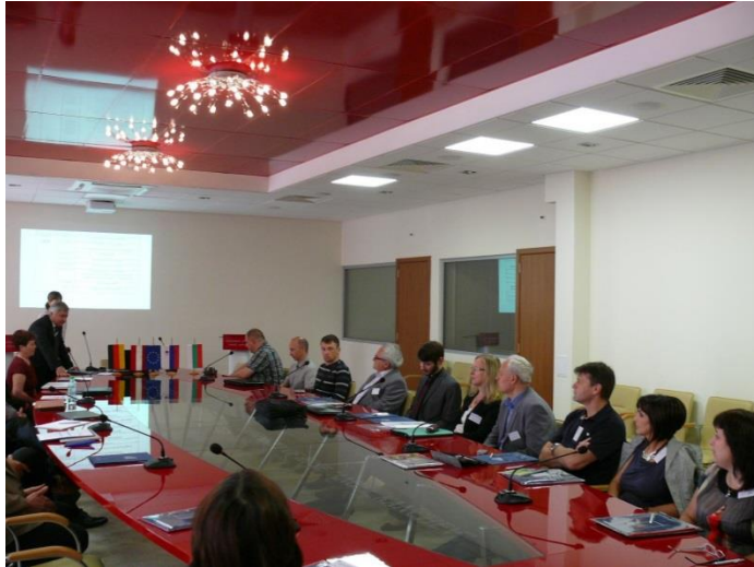
Партньорска среща в гр. Русе, май 2015г