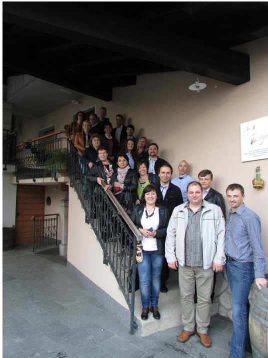
Партньорска среща в Словения, май 2016г